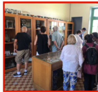
Visite gratuite comprise avec la balade